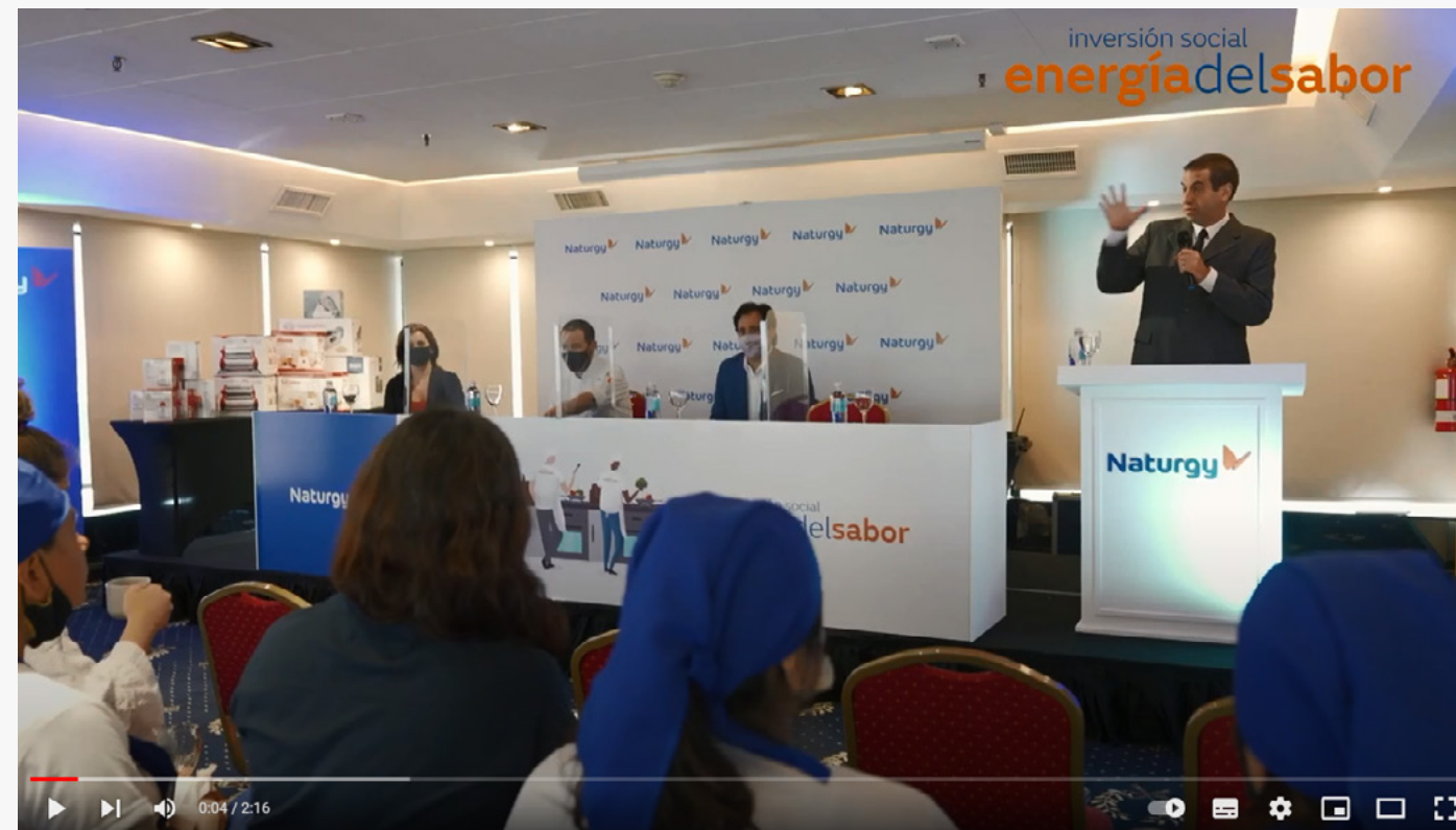
Finalizamos la edición 2021 de #EnergíaDelSabor (Video)