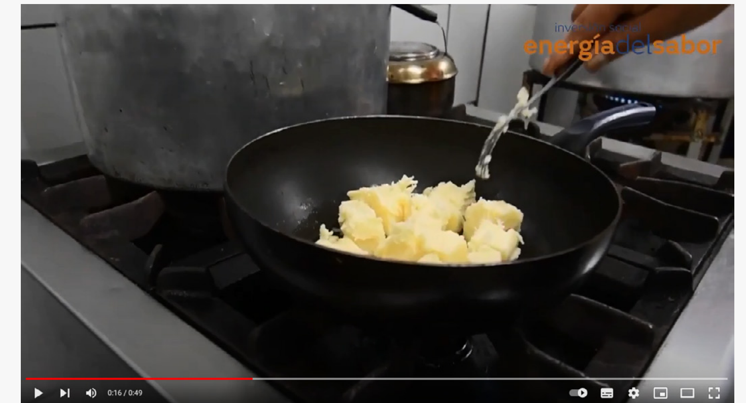
Programa Energía del Sabor y Asociación Civil Peregrina - 9 de julio 2021 (Video)