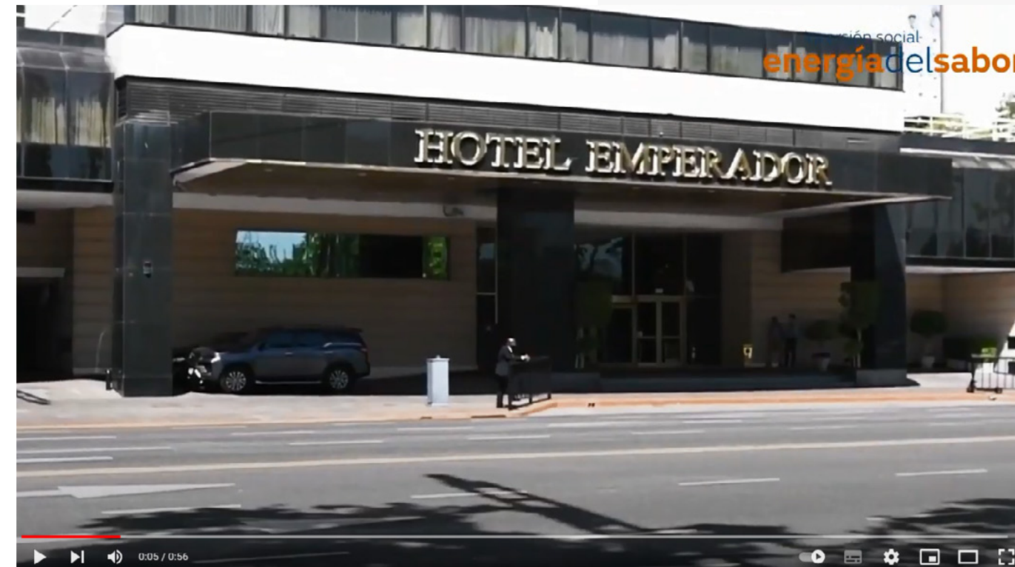
Visita al Hotel Emperador - Programa Energía del Sabor (Video)